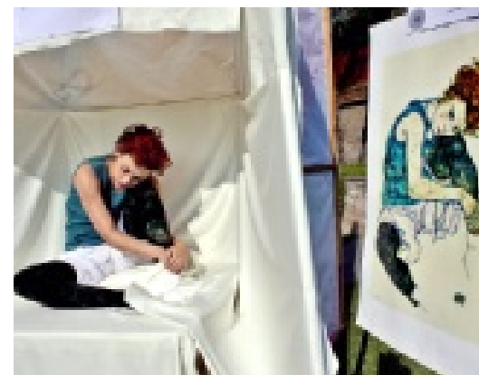
► “Seated Woman with Bent Knee” de Egon Sttiele, fue una de estas obras representadas como parte del trabajo final de la materia de Educación Estética.

Alumnos de la Universidad Panamericana organizaron una galería viviente en la que debían representar una pintura famosa.