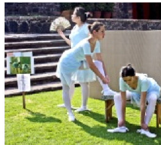
► Participaron 41 estudiantes de la carrera de Pedagogía, como estas tres alumnas que recrearon “The Dancers at The Dancing Class”, de Edgar Degas.